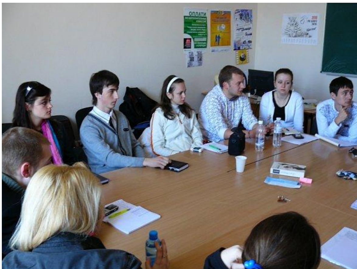
Засідання студентської колегії університету