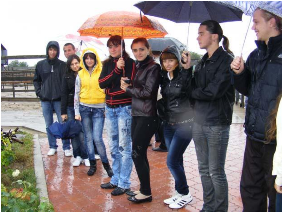
Виїзд студентів університету на екскурсію