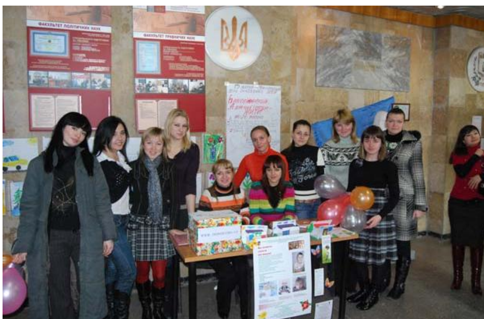
Студентська благодійна акція