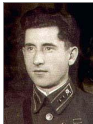
Л. І. Бубер – Герой Радянського Союзу