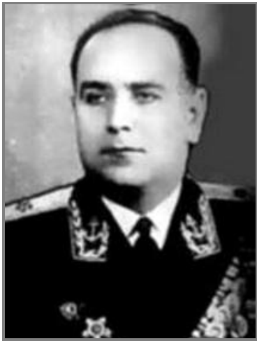
М. П. Єгипко – Герой Радянського Союзу