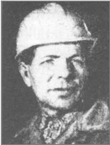
М. О. Ніконенко – Герой Соціалістичної Праці