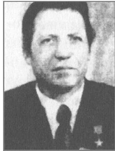
В. Д. Дідок – Герой Соціалістичної Праці