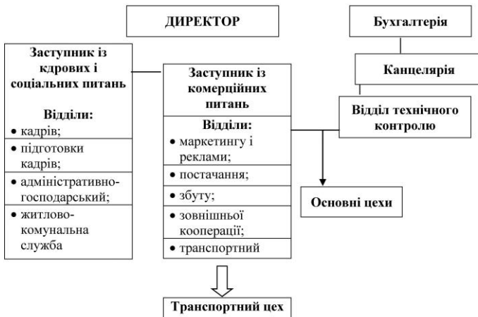
Рис. 1.2. Загальна структура машинобудівного підприємства

Підприємство очолює директор. Він здійснює керівництво виробництвом у цілому, тобто репрезентує підприємство в будь-яких організаціях, розпоряджається в межах чинного законодавства його майном, укладає договори, відкриває в банках розрахункові рахунки тощо.