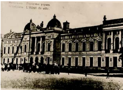
Миколаївське міське управління (новий будинок)

почалася епідемія натуральної віспи, захворіла велика кількість дорослих і дітей. З боку міської думи не було проведено жодних заходів щодо ліквідації хвороби до розпорядження військового губернатора [89, арк. 1]. Гласні і чиновники свої жалюгідні обов’язки виконували погано: відсидівши день до вечора в присутстві, поспішали до домівки. Але не можна звинувачувати цих людей в усіх гріхах.