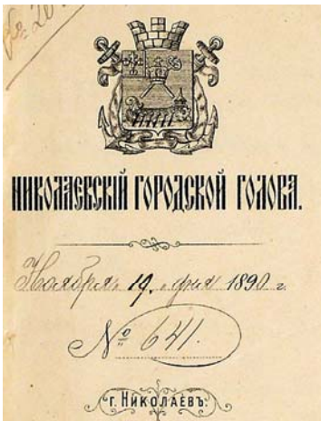
Кутювий штамп з офіційного бланка Миколаївського міського голови, 1890 р.

Міська дума на проведення виборів завжди просила дозволу у військового губернатора, наглядали за ходом виборів поліцейстр і повітовий стряпчий [85, арк. 12]. Списки