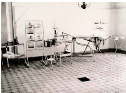
Интер'єр хірургічного павільйону Миколаївської міської лікарні

25 червня 1871 р. Миколаївський військовий губернатор М.Аркас у наказі місцевим установам самоврядування писав: “...підвідомчі мені присутственні місця і посадові особи дуже повільно виконують розпорядження мої, що обтяжує