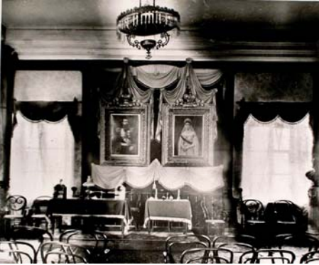
Зал засідань Миколаївської міської думи

24 травня Глазенап запросив членів думи в будинок головного командира, де відбулося засідання з приводу будівництва в Миколаєві комерційної пристані в Поповій балці.