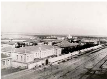
Панорама Миколаївської міської лікарні

Про ступінь впливу Миколаївського особливого у міських справах присутствія, самостійність чи несамостійність міського громадського управління можна судити з такого факту. Міський голова А.Акимов 16 січня 1873 р. на зборах міської думи запропонував розглянути питання про дозвіл купцю Сорокіну будувати дім на існуючому виступі на вул. Соборній і заслухати доповідь голови пожежної комісії Рено про прогидію миколаївського поліцмейстера розпорядженням комісії по пожежному обозу. Військовий губернатор М.А.Аркас запропонував міському голові “не допускати на зборах думи обговорення згаданих вище двох питань і на майбутнє в жодному випадку не вносити на розгляд думи таких питань, які очевидно могли б порушити права урядових установ та існуючих на цей предмет постанов...” А.Акимов відстоював свою думку і заявив військовому губернатору, що запропоновані питання