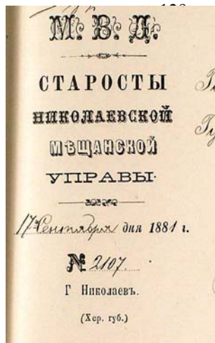
Кутювий штамп з офіційного бланка Старости Миколаївської міщанської управи, 1881 р.

“Городове положення” від 11 червня 1892 р. стало міською контрреформою. Воно замінило податковий ценз майновим. Виборчі права отримали тільки ті мешканці міста, які мали нерухомість, оцінену особливою комісією на суму від 300 руб. і вище. Таким чином, кількість виборців скоротилася в декілька разів. Поділ на розряди був скасований, виборці склали одні виборчі збори. За положенням 1892 р. євреї були викреслені з числа виборців і гласних. У місцевому самоуправлінні вони брали участь через своїх представників у думі, але не більш ніж 1/10 від всього складу думи. З 1892 р. міський голова і члени міської управи отримали статус державного службовця. Положення 1892 р., не згадуючи про самостійність дій міського