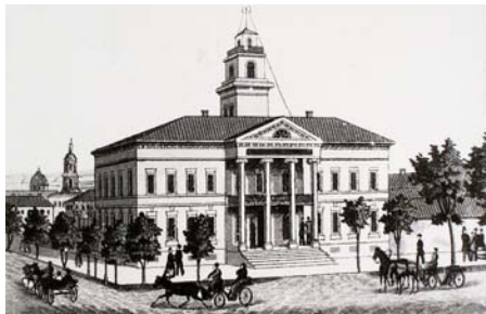
Міські присутственні місця

Б.О. фон Глазенап шість з десяти років свого перебування на посаді військового губернатора працював разом з міським головою Федором Івановичем Соболевим. Автор посібника має думку, що губернатор спеціально впливав на хід виборів, щоб забезпечити Ф.І.Соболеву перемогу. Так, на виборах 1866 р. на посаду миколаївського міського голови було обрано А.А.Ковальова (159 – за, 76 – проти), Ф.І.Соболева було обрано його заступником