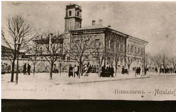
Будинок міської поліції м. Миколаєва

В Севастополі у 1803 р. де Траверсе запропонував новий план забудови міста. У 1805 р. він клопотав про укріплення Севастополя з суші. У 1809 р. представив проєкт “про підняття Севастополя на ступінь першокласної фортеці”, для чого запропонував обнести все місто кам’яними стінами з bastions і ровами. Після проведених під керівництвом де Траверсе робіт морський міністр П.В.Чичагов віддав належне активній діяльності адмірала і написав, що тепер це місто вперше в змозі себе захистити [500, арк. 6; 393, с. 257; 526, с. 48-49].