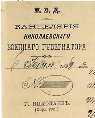
Кутувий штамп з офіційного бланка Канцелярії Миколаївського військового губернатора, 1898 р.

Севастополем були влаштовані переговорні телеграфи-семафори. В Севастополі будувались казарми, кам'яна пристань, морські батареї, два водопроводи для міста та для забезпечення водою кораблів флоту. В цей час почались дослідження руїн Херсонеса, там спорудили храм в пам'ять хрещення святого Володимира [6, с. 135; 502, с. 50-61; 443, с. 3-9; 504, с. 1-11; 19, с. 32-39, 40-45, 48-51, 122-123; 390, с. 16-21].