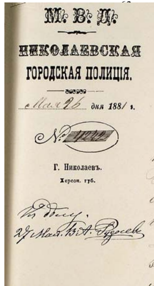
Кутовий штамп з офіційного бланка Миколаївської міської поліції, 1881 р.

Багато уваги приділяв О.С.Грейг будівництву Миколаєва: влаштовано пристань для комерційних суден, тротуари, ліхтарі, будки для караульних, канали для стікання води. На самому занедбаному місці на березі Інгулу за наказом Грейга спланували, розбили, засадили деревами бульвар (сучасний бульвар ім. адмірала С.О.Макарова), який ще з першої половини XIX ст. став улюбленим місцем відпочинку миколаївців. В цей же час побудовано міст через р. Південний Буг, який з'єднав Спаськ з Варварівкою; по березі річок Південний Буг і Інгул влаштовано рятувальні станції; призначено винагороду брандсбойщикам, які першими прибували на пожежу; відкрито богадільню, в якій передбачалися місця для покинутих новонароджених. Грейг запросив у Миколаїв іноземців Самасі і Аляуді. Перший відкрив цегельню, черепичну і фаянсову фабрики, а другий – механічний вітряк, за допомогою якого вироблялось сукно і фланель. Між Миколаєвом і