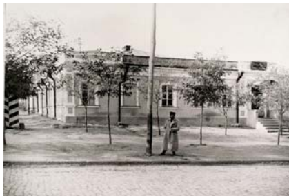
Одеська поліцейська частина м. Миколаєва

55 кількість жителів приходиться 5 церков і один молитовний будинок, дві богадільні, 1000 домів і 188 землянок, 233 лавки, 7 заводів (з них два горілчаних і один пивоварний), 22 питейних будинки, 82 погребі, 14 харчевень і пекарень, 4 торгові лазні. Крім цього, на міській землі знаходилось 66 хуторів [105, арк. 13].