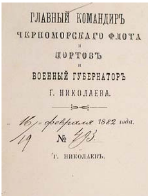
Кутовий штамп з офіційного бланка Головного командира Чорноморського флоту і портів, 1822 р.

У 1825 р. адміралтейські поселення були безпосередньо підпорядковані Управлінню чорноморських адміралтейських поселень, яке знаходилось в Миколаєві і в