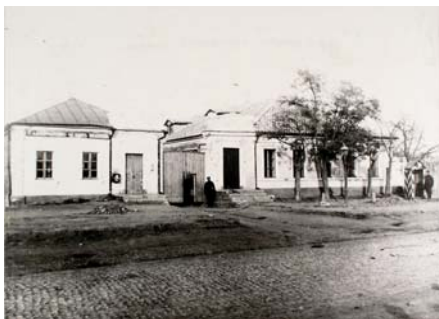
2-га Адміралтейська поліцейська частина м. Миколаєва

У 1808 р. І.І. де Траверсе виклопотав дарування Миколаєву “чотирирічної відкупної суми” – 240000 руб., проценти з якої щорічно повинні були складати 14400 руб. На ці гроші він сподівався збудувати казарми, присутствені місця, пристань, школи. Вже губернатором О.С.Грейгом у 1821 р. в Миколаєві на ці кошти було засновано “Городовий комітет” – банківську установу,