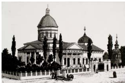
Церква Пресвятої Богородиці усіх скорбящих радості

Окрему національну й релігійну категорію становили євреї, які почали селитися в Новоросійському краї задовго до заснування губернаторства. Першими тут з'явилися в другій половині XVIII ст. переселенці із Польщі і Західної Росії. У 1807 р. вони заснували в Херсонському повіті перші землеробські колонії, у цей же час євреї оселилися в Миколаєві і Севастополі [26, с. 68-69]. У 1811 р. у Миколаєві вже існував кам'яний єврейський молитовний будинок [111, арк. 14-16]. Чорноморські верфі давали багато роботи єврейським підприємцям і купцям. Головне управління Чорноморського флоту не могло обійтися без постачальників-євреїв: