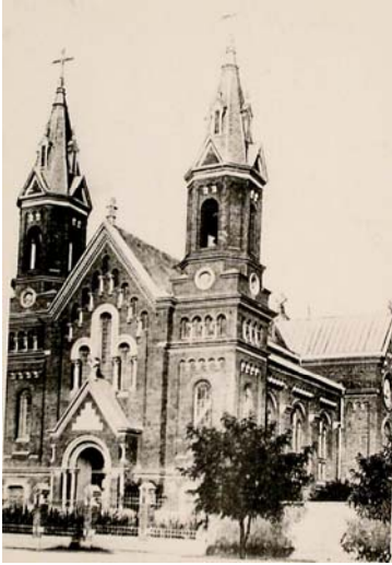
Католицький собор у м. Миколаєві

1857 р. встановив за іноземцями гласний поліцейський нагляд і почав відправляти їх за кордон за власний кошт, а їх будинки, лавки й товари продавати за безцінь. Виручені кошти у випадку виїзду іноземця на батьківщину пересилались йому через відповідні консульські установи [145, арк. 1, 7, 10-11, 15, 25, 28, 30, 39-40, 44, 47, 52].