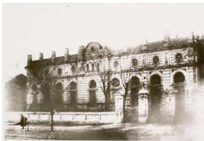
Синагога на вул. Привозній у м. Миколаєві

Сам О.С.Грейг, особливо в останні роки перебування на Півдні, неодноразово піддавався нападкам і доносам з боку шовіністично настроєних російських дворян. Серед них були майбутній мовознавець В.І.Даль, Ф.Ф.Вігель, адмірал М.П.Лазарев [390, с. 21-22]. Причиною став таємний шлюб адмірала О.С.Грейга, хрещеника Катерини II, з єврейкою Юлією (Лейкою) Михайлівною Сталінською. Красуня Юлія була в Миколаєві законодавицею мод. Володіючи тонким смаком і чарівністю, зуміла створити в адміральському будинку салон, до якого входили молоді офіцери і чиновники Чорноморського флоту й адміралтейства. Вона