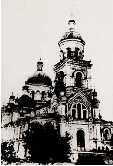
Церква у с. Богоявленську

Кращий результат дає розгляд даних за ознакою “рідна мова”. Як правило, люди, що говорять на мові даного народу, є представниками цього народу. Але треба зазначити, що за переписом 1875 р. термін “говорити” російською мовою вживався по відношенню як до росіян, так і до українців. В Миколаївському військовому губернаторстві переважним виявилось населення, яке говорило російською мовою – 71525 чоловік, що склало 87% від загального числа жителів. У тому числі в Миколаєві – 49413 осіб (82%), 27715 чол. і 21698 жін., у передмістях – 19145 осіб, на хуторах – 2967. На другому місці знаходилися особи, що визнали рідними єврейські