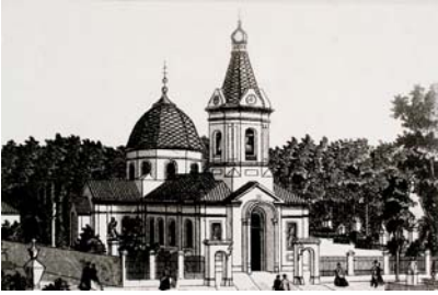
Церква на цвинтарі Во ім'я всіх святих

В останній рік свого існування, за даними “Огляду Миколаївського військового губернатора за 1899 рік”, населення Миколаєва нараховувало 79283 особи (42639 чол. і 36644 жін.); у 5-ти хуторах проживало 5055 осіб (2535 чол. і 2520 жін.); усього в губернаторстві – 84338 осіб. Але тут же відзначалося, що зазначена цифра отримана, як і в минулі роки, відповідно