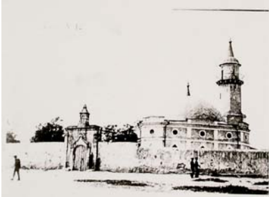
Татарська мечеть у м. Миколаєві

назвою “малоросіяни”. Тому виділити окремі групи росіян, українців, білорусів неможливо.