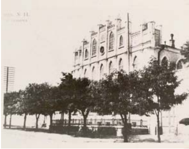
Загальний вигляд хоральної синагоги у м. Миколаєві

“вигідніше і діяльніше їх не знаходилося” [350, частина неоф., с. 163-164, 167]. Євреї вільно проживали у південних містах, найбільш активні навіть брали участь у міському самоврядуванні [345, с. 54-59].