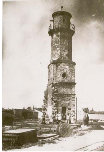
Мінарет мечеті у м. Миколаєві за радянських часів

В іншій доповідній записці від 3 листопада 1856 р. Севастопольський військовий губернатор Ф.Д.Бартенев повідомляє, що після залишення союзними військами Севастополя наїхало до міста багато іноземців з метою торгівлі. Тому поліції необхідно вислати всіх іноземців, в тому числі греків і євреїв, до Євпаторії або за кордон. Їх відправка була покладена на жандармського полковника Щербачова. Поліція вимагала від них підписку про виїзд, але впевнившись, що добровільно вони не виїдуть, вирішила застосовувати до них більш жорсткі засоби. Було встановлено останній термін для виїзду – 15 травня 1857 р. Іноземців зібрали в поліції і оголосили їм повеління імператора покинути Росію. Вони ж вважали, що указ імператора підроблений. Француз Драгон “схватив себе за голову обома руками і, тупаючи ногами, кричав”, що він не бажає виїжджати з Севастополя. Така ж реакція була й у француза А.Гюго та інших. Незважаючи на протести іноземців, адмірал П.М.Вукотич, згідно з розпорядженням Новоросійського генерал-губернатора графа А.Строганова, після 15 травня