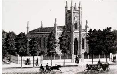
Лютеранська церква у м. Миколаєві

євреї, поляки і німці. У “Короткому огляді діяльності статистичного комітету Миколаєва у 1875 році” відзначено, що число жителів губернаторства було визначено майже з математичною точністю. Навіть петербурзький перепис 1869 р., у який були вкладені солідні кошти, не дав таких точних результатів, як миколаївський.