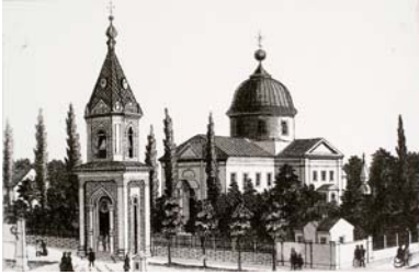
Адміралтейський собор у Миколаєві

Севастополі, підштовхуючи їх переходити у вічне підданство Росії. Більшість з них поступала на службу в Чорноморський флот. Так, на початку XIX ст. у Севастополі з'явилися греки, англійці, італійці, євреї тощо.