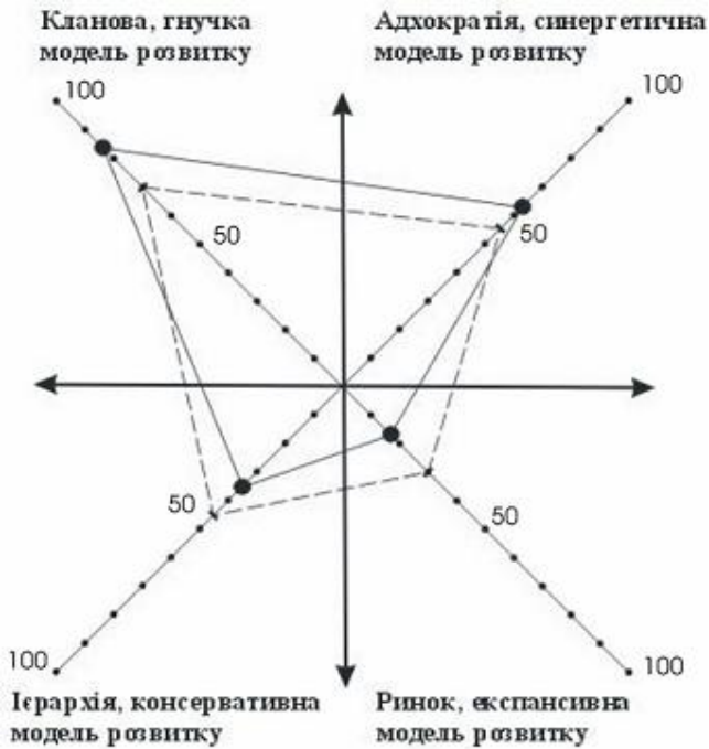
Рис. 1.4. Профіль організаційної культури та моделі розвитку університетської освіти