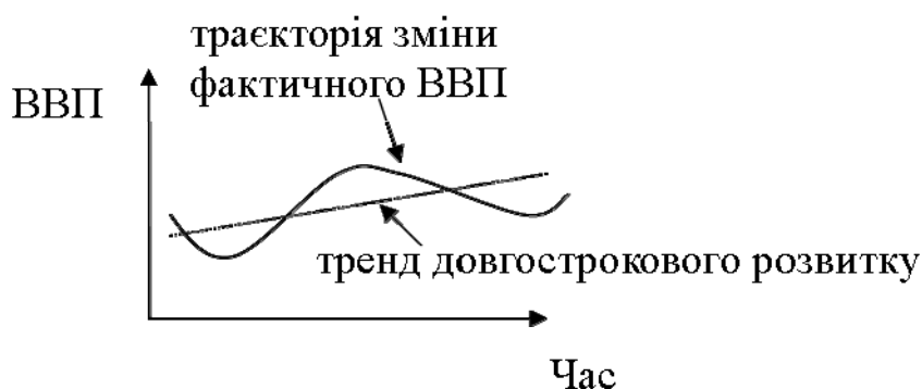
Рис. 14-1. Тренд та циклічні коливання

Схематично економічні цикли зображаються таким чином: