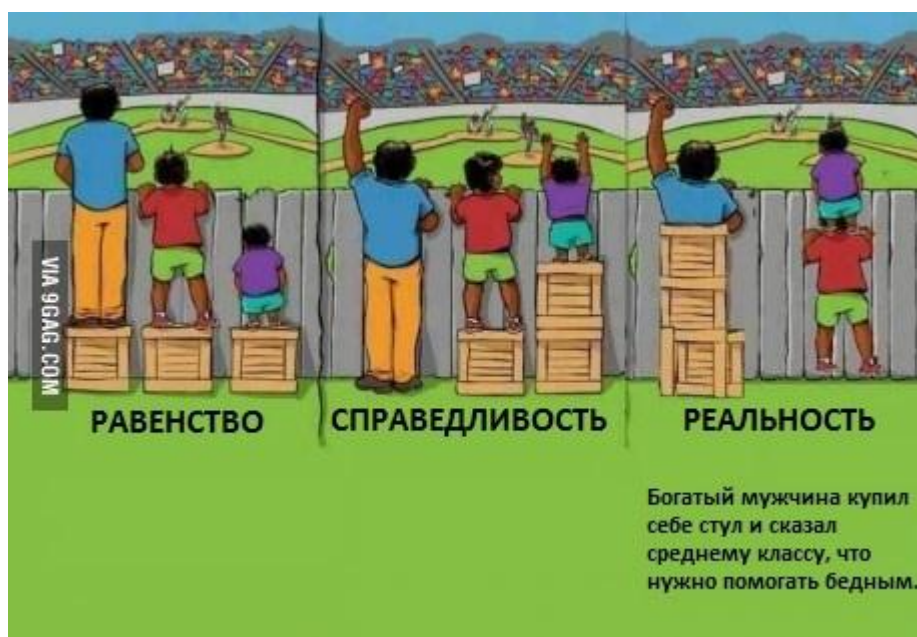
Рис.2. Наближений до реальності варіант з усієї цієї серії картинок [12]

У графічній формі в Інтернеті легко знайти ілюстрації на порівняння цих концептів. Так, самий наближений до реальності варіант з усієї цієї серії картинок представлений на рис. 2.