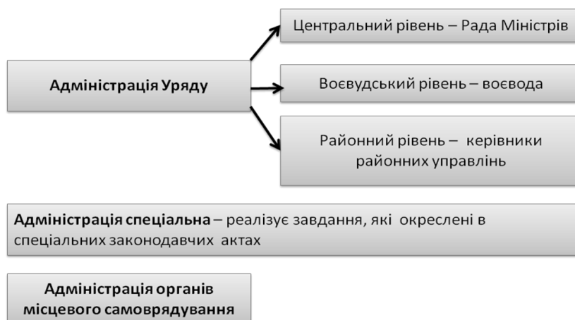
Рис. 1. Система органів публічної влади в Республіці Польща (розроблено на підставі законодавчих актів)

На Рис. 1. продемонстровано структуру публічної влади, яка демонструє незалежність органів місцевого самоврядування. До спеціальної адміністрації відносять інституції, які підлягають безпосередньо власному керівництву або відповідному міністру (наприклад, військовий штаб, морські управління, прикордонна служба, статистичні адміністрації тощо). Варто також зазначити про районний рівень, який відноситься до адміністрації Уряду, оскільки воєвода несе відповідальність за результати діяльності цих управлінь, а саме – пожежна санітарна, ветеринарна служби, наглядова інспекція за будівництвом тощо.