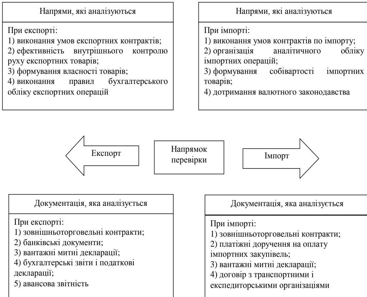
Рис. 2. Напрями перевірки, яка здійснюється аудиторами в рамках завдання митного органу з виявлення фінансових та інших порушень при проведенні контролю на засадах митного постаудиту

Результатом роботи має стати експертний висновок, звіт, рекомендації або інший документ, який надається керівнику ревізійної комісії для включення в акт або робочу документацію за результатами перевірочних заходів. Крім того, залучення таких фахівців доцільно також і при проведенні роботи, пов'язаної з аналізом фінансово-господарської діяльності учасників ЗЕД. Дана діяльність може бути спрямована на перевірку якісного стану майна, ефективність використання капіталу та інших питань, безпосередньо пов'язаних з фінансово-господарською діяльністю.