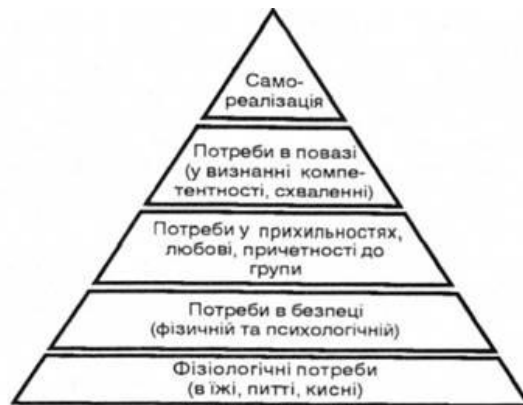
Рис. 2. Піраміда Маслоу

Бюджетування окремих структурних підрозділів є рішенням, яке абсолютно необхідне для будь-якого суб'єкта економічної діяльності, що діє в умовах ринкової економіки. В адміністративно-плановій економіці домінуючим важелем мотивації персоналу до підвищення якості було моральне стимулювання з елементами економічного стимулювання. Ринкова економіка висуває економічний важіль стимулювання в якості основного, елементи морального стимулювання пропорційні складовим частинам піраміди Маслоу (рис. 2).