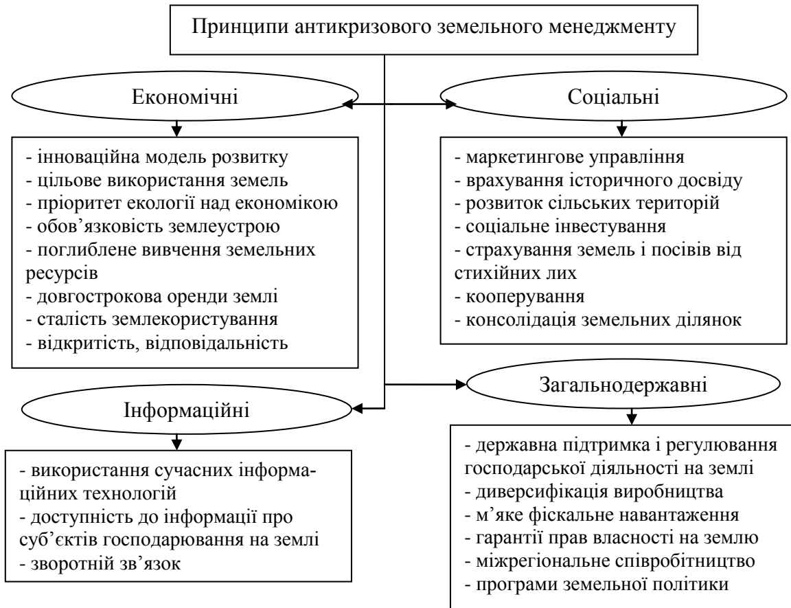
Рис. 3. Принципи антикризового земельного менеджменту *