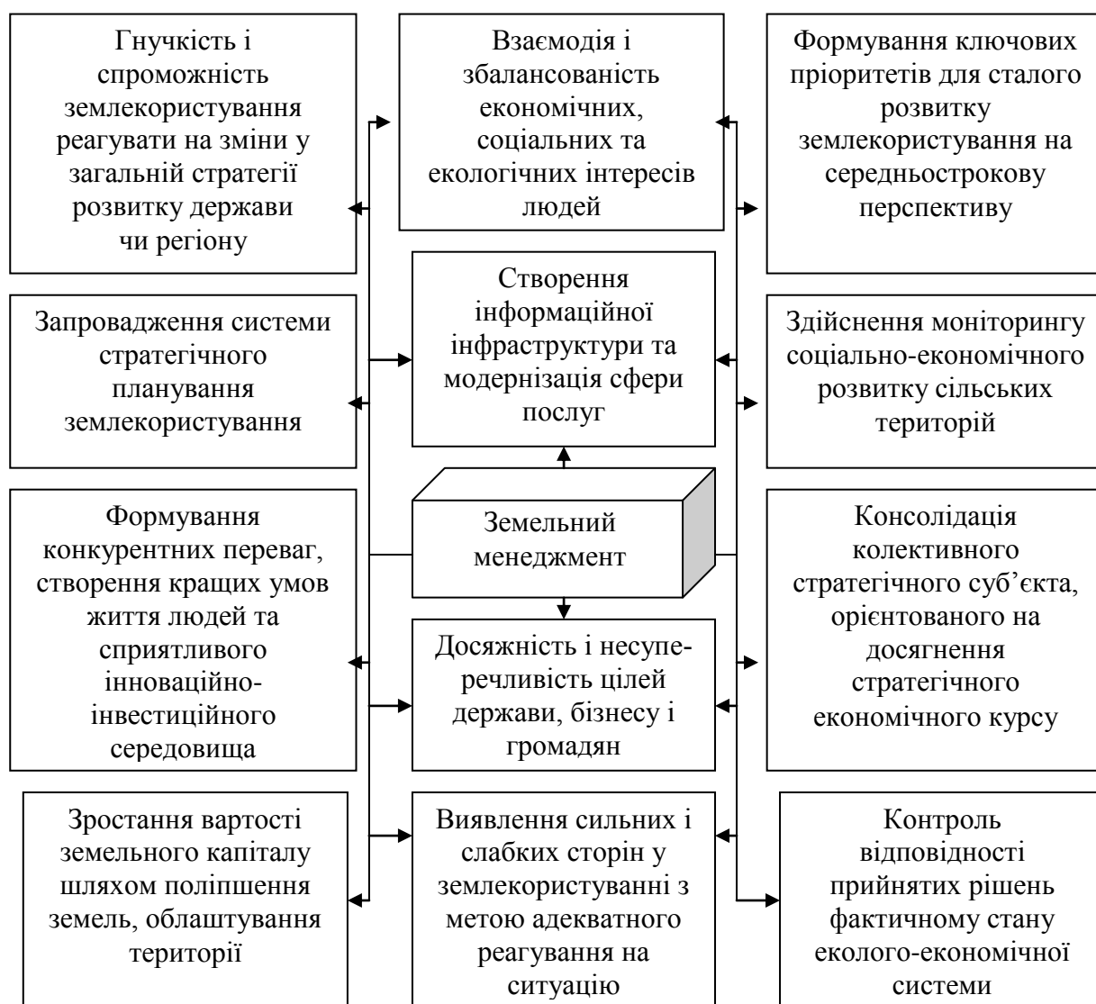
Рис. 5. Роль земельного менеджменту у стратегії розвитку сільськогосподарського землекористування