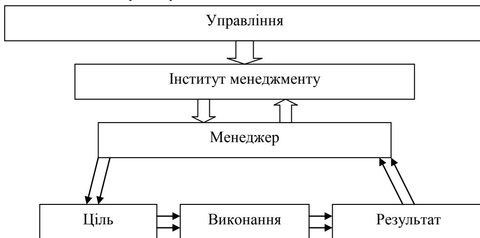
Рис. 2. Місце менеджера у структурі управління землею *

З вище наведеного випливає, що постає менеджера є інституціонально центричною у механізмі прийняття управлінських рішень, тобто, з одного боку, менеджер як один з працівників, є підлеглим до засновника (власника, хазяїна) об'єкта управління (землями, сільськогосподарським підприємством), має виконувати певні функції, дотримуватися норм і правил поведінки, культури тощо. З іншого ж боку, менеджер як окрема управлінська ланка, у структурі якої є свої, підлеглі йому, працівники, вже вони виконують його розпорядження, є безпосередніми виконавцями доручень та стратегічних міркувань менеджера. Мається на увазі, що менеджер, застосовуючи свої теоретичні знання та практичні навички, планує, організовує, розпоряджається, погоджує, мотивує та контролює виконання планів, стратегій для досягнення чітко визначених цілей (рис. 2).