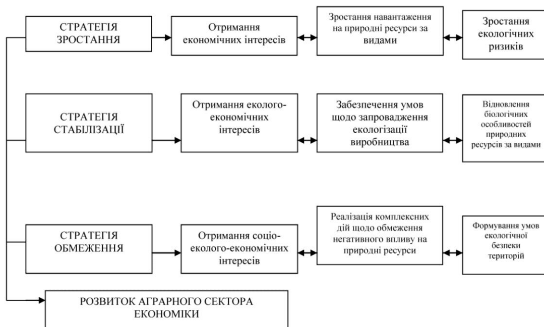
Рис. 2. Стратегічні напрями природно-ресурсного забезпечення розвитку аграрного сектора економіки