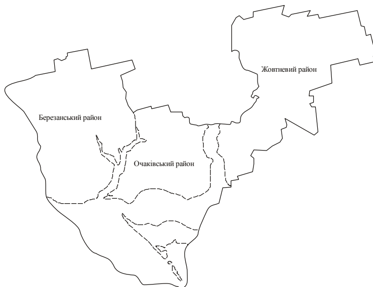
Рис. 1. Соціоекосистема Миколаївське Причорномор’я

Вибір саме цієї соціоекосистеми обумовлений тим, що Причорномор’я України володіє значним природним енергетичним потенціалом. Тут поєднано три джерела альтернативної енергії – Сонце, вітер та хвилі [3].