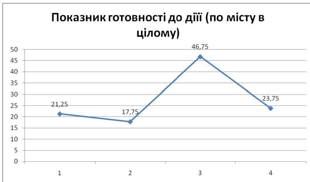
Рис. 5. Діаграма готовності до дії населення щодо покращення екологічного стану міста.

Показники готовності населення до покращення екологічного стану міста наведено на діаграмі рис. 5.