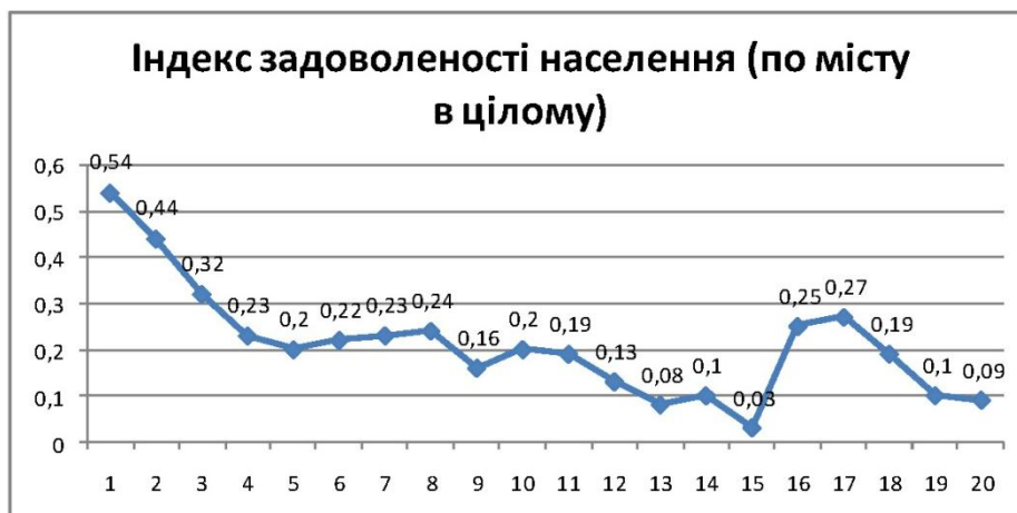
Рис. 2. Діаграма індексу задоволеності населення.

Отже, лише 4 % респондентів Миколаєва повністю задоволені станом довкілля м. Миколаєва в цілому, більш ніж третина (37 %) задоволена цим параметром частково і близько половини (56 %) незадоволені. Мали труднощі висловити певну думку лише 3 % респондентів. Індекс задоволеності складає 0,23 і знаходиться на низькому рівні.