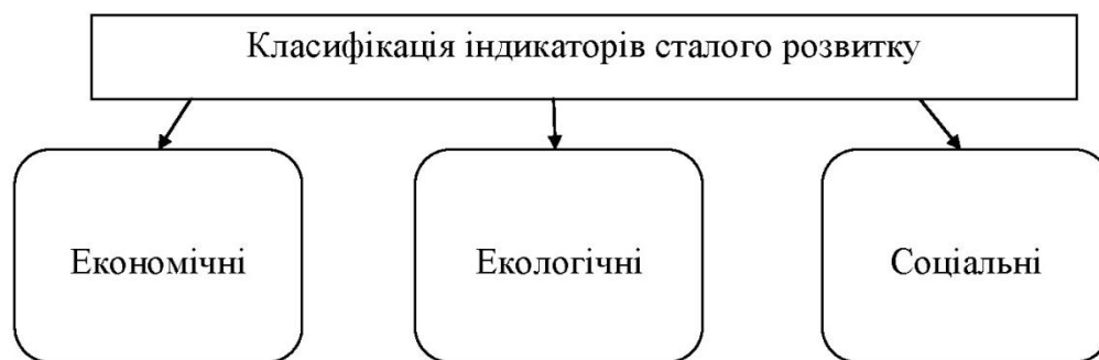
Рис. 1. Основні групи індикаторів сталого розвитку.

Серед індикаторів сталого розвитку національного рівня виділено три основні групи: економічні, екологічні, соціальні (рис. 1).