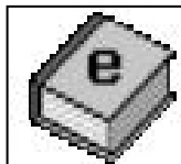
Каталог МЕТОДИЧНА ЛОЦІЯ

«Методична лоція», яка зорієнтована на викладача вищого навчального закладу, учителя літератури, шкільну та студентську аудиторію, бібліотекаря та керівника дослідно-пошуковими роботами, проектами, передбачає виконання функції путівника й укладалася як звід каталогів із різних напрямів методики літератури.