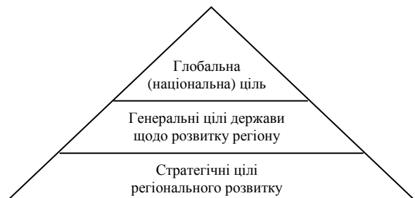
Рис. 1.1. Піраміда цілей державного регулювання економіки регіону

Система цілей державного регулювання економіки регіонів характеризується ієрархічною підлеглистю, яка може бути зображена як піраміда цілей (рис. 1.1)