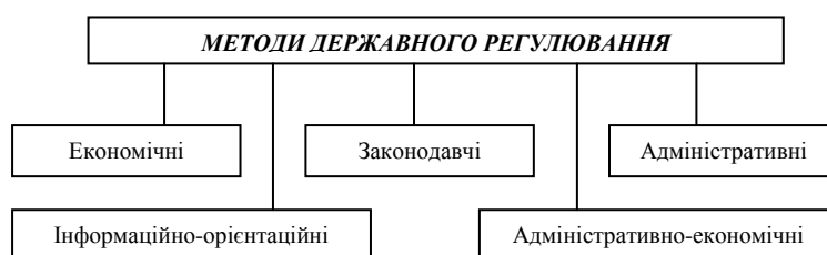
Рис. 1.4. Методи державного регулювання розвитку регіону

Економічні методи: це методи впливу на попит і пропозицію товарів, на умови формування економічних ресурсів, витрат і результатів, що включають державне споживання, бюджетну політику, оподаткування, регулювання грошового обігу і надання кредитів, фінансування виробництва, митне регулювання, регулювання цін на товари і тарифів на послуги [259, с. 27].