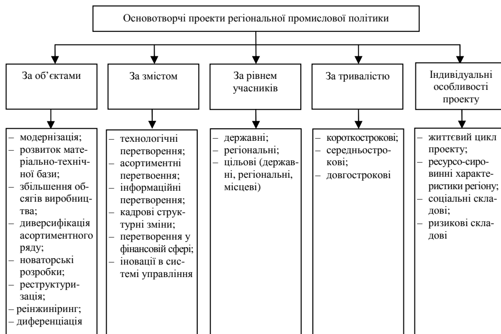
Рис. 4.1. Запропонована класифікація проектів, що становлять основу регіональної промислової політики

Класифікація ключових проектів регіональної промислової політики, представлена на рис. 4.1.