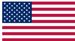
Рис. 24.4. Прапор США

Усічена піраміда складається з 13-ти цегельних ярусів , де кожна цегла позначає окремих народ або державу. Називають її «пірамідою Ілюмінатів». Структура Ілюмінатів складається з 13 ступенів посвячення в істину. Це ціла група масонських лож. У вершині – трикутника (ще один масонський символ!) – око. Фахівці називають його по-різному: «Всевидюче і Всезнаюче Око» «невидимого правителя» усім світом, око «Великого Архітектора Всесвіту», «око Люцифера», тобто Сатани (рис. 24.2). Якщо зобразити іудейський символ – зірку Давида на шість кутів, то з літер у вершинах трикутників можна утворити слово M.A.S.O.N. Символ «вершини» увінчаний латинським написом з 13-ми літер : «Annuit Coeptis» – «благословенні всевишнім», що підкреслює, якому «обраному» класу дано правити світом. Під пірамідою написано «Novus Ordo Seclorum» – «Новий Світовий Порядок» (рис. 24.3).