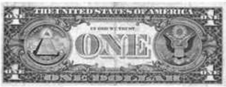
Рис. 24.1. Один долар США