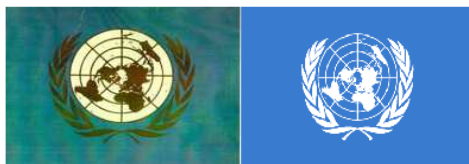
Рис. 24.6. Емблема і прапор ООН