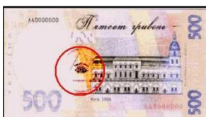
Рис. 24.5. Купюра України

А яке має відношення ООН до масонів? Емблема ООН (рис. 24.6) підготовлена Керівництвом стратегічних служб США у квітні 1945 р. у вигляді земної кулі з двома маслиновими гілками: число листків в одній гілці дорівнює 13, число «ієрархічних рівнів» листів – 7. Обидві цифри – масонські й призначені для підтвердження могутності масонів.