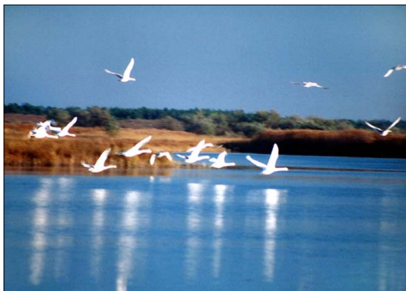
Білі лебеді – 3

серія робіт „Білі лебеді”. Від блакитно-сірувато-синьої затоки до ніжних блакитно-сірих тонів неба, а між ними – жовто-вохриста смуга берега, і на цій акварелі – прекрасні граціозні білі птахи.