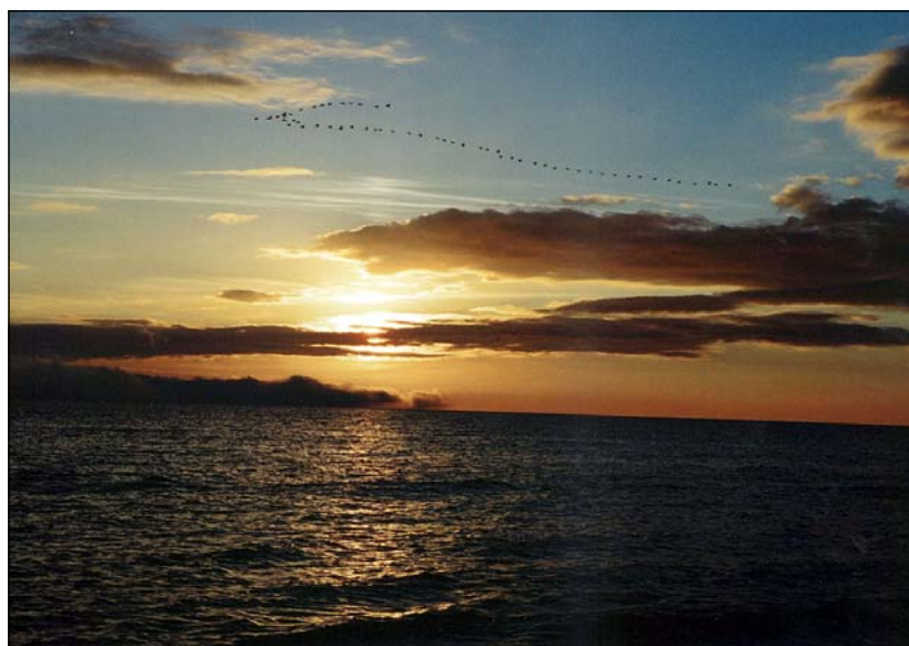
Хроніка одного заходу сонця – 1

Ліворуч: на воді – жовтуваті відблиски сонця, що вже прощається з днем. По лінії горизонту небо жовто-вохристе, далі – жовтувато-сіре та ніжно-блакитне вгорі. На цьому тлі темною стрічкою пролітає пташиний клин („Хроніка одного заходу сонця – 1”).