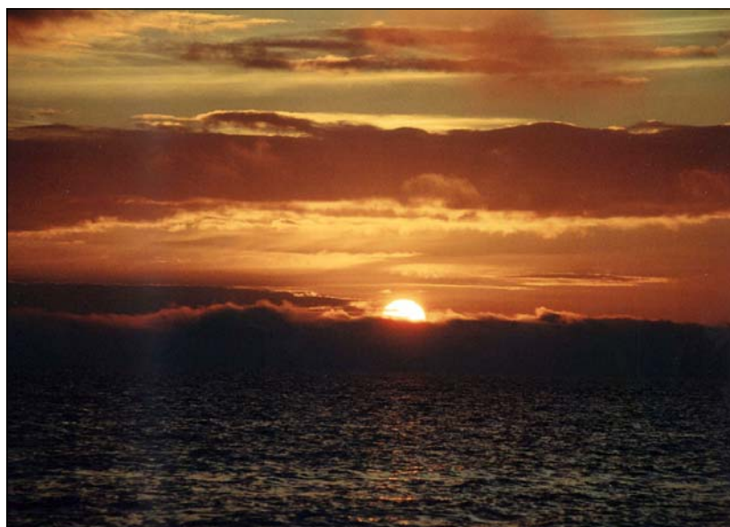
Хроніка одного заходу сонця – 3

у композиції „Хроніка одного заходу сонця – 3”.