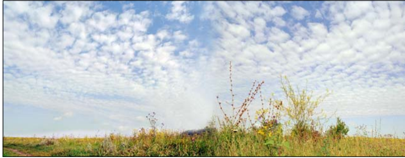
Небо для жайворонків

враження живописного полотна („Блакитна затока”).