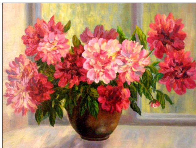
Заїкін О.І. Пієонії. Живопис