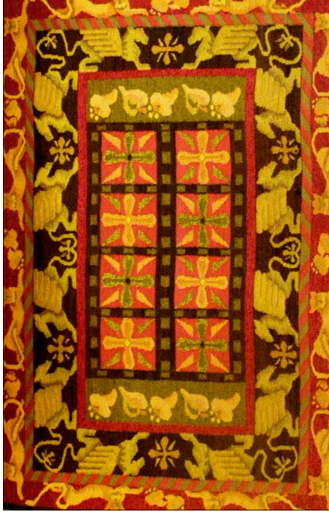
Вронська Рада За скіфськими мотивами. Килим. Ручне ткацтво