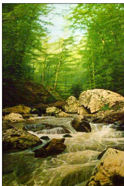
Кіпер Ф. Водоспад. Живопис