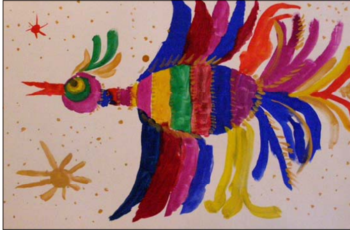
Куценко Олександра Веселковий журавель. Малюнок