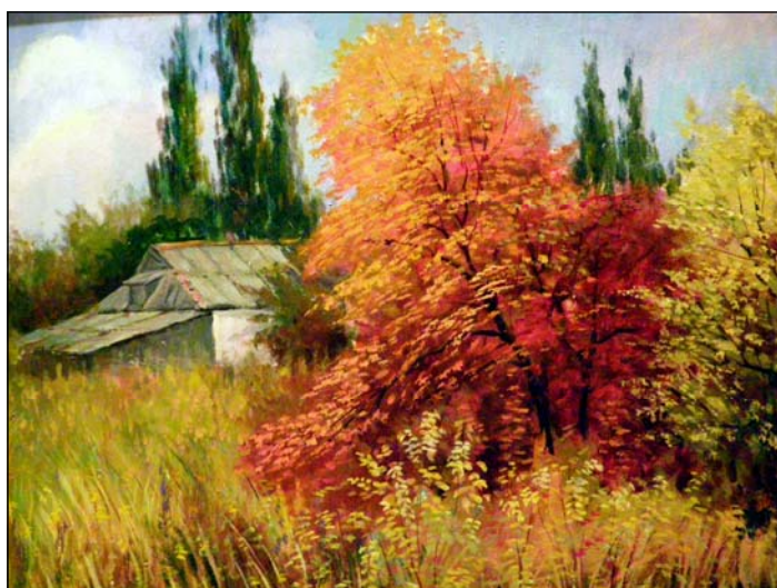
Заїкін О.І. Осінь. Живопис