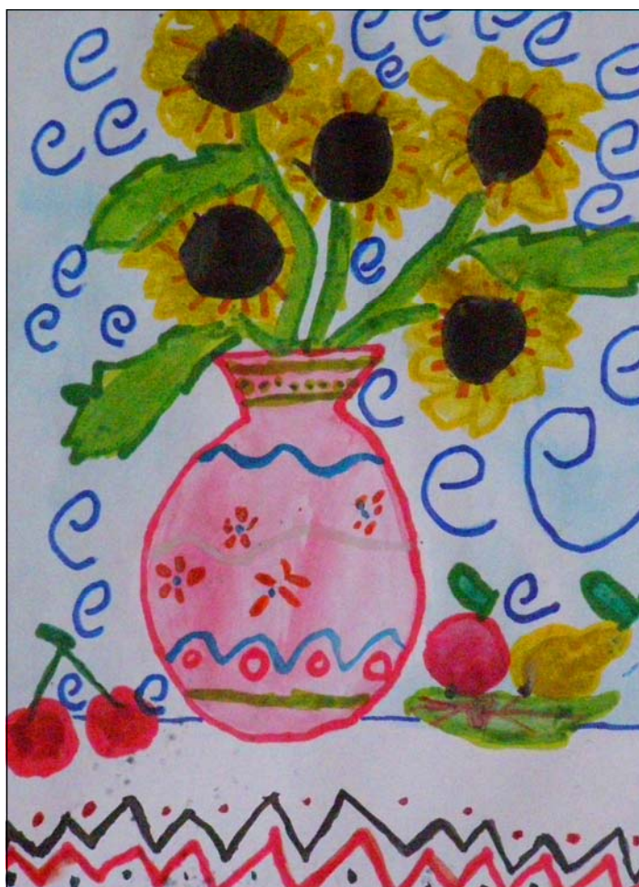
Кривцов А. Натюрморт. Малюнок