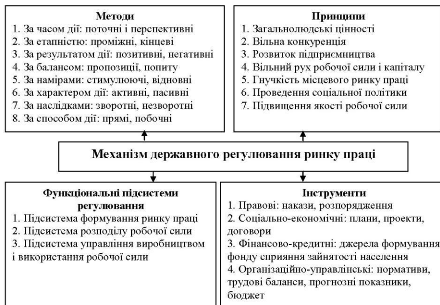
Рис. 2. Формування механізму регулювання ринку праці

Якщо дати загальну оцінку вищезазначеній систематизації заходів та важелів державного регулювання зайнятості населення, то стає очевидним, що слід використовувати їх у комплексному поєднанні (рис. 2) [3].