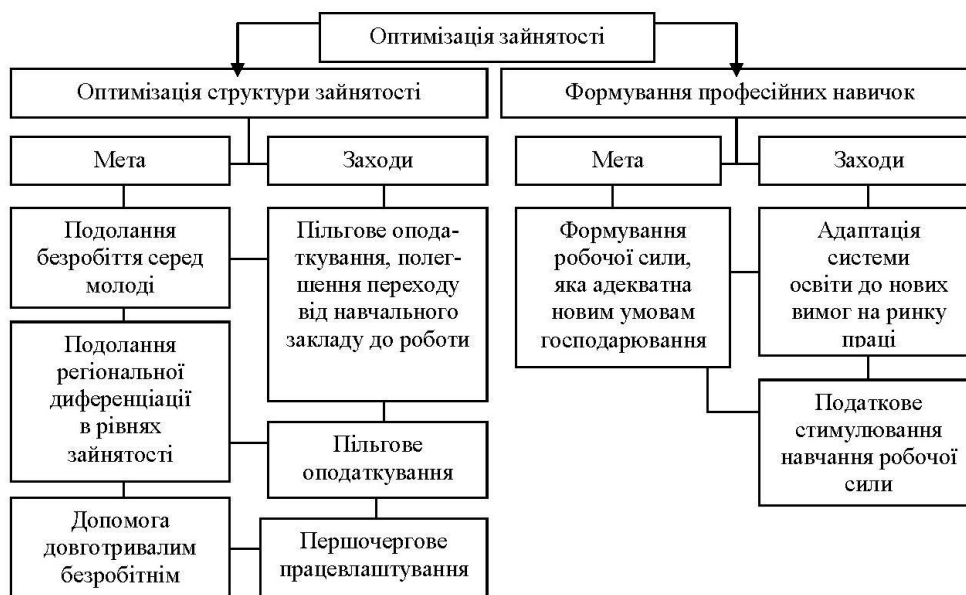
Рис. 3. Цілі та заходи реалізації державної політики щодо оптимізації зайнятості

Для подолання цих проблем необхідно здійснити оптимізацію структури зайнятості й формування професійних навичок (рис. 3) [1].