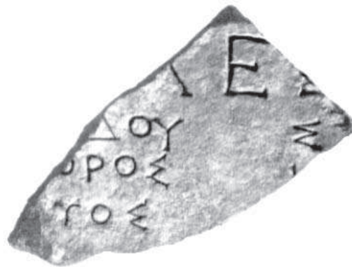
Рис. 1. Фрагмент НО 168

Фрагментоване посвячення НО 168 (рис. 1) уперше опубліковане у збірнику «Написи Ольвії». Видавці зазначили, що пам'ятка ця є списком імен, відмітили його композиційну схожість із посвяченням НО 71 жерців Евресибіадів Зевсу Сотеру (рис. 2) та датували кінцем IV – початком III ст. до н. е. Перший рядок пам'ятки, в якій літери виконані втричі більшим розміром, ніж у інших рядках, видавці відновили як Λεοκράτης. У 1975 р. А.А. Білецький [4] підтвердив датування пам'ятки і читання першого рядка, а також дав припущення відновлення імен у наступних рядках, яке буде розглянуто нижче.