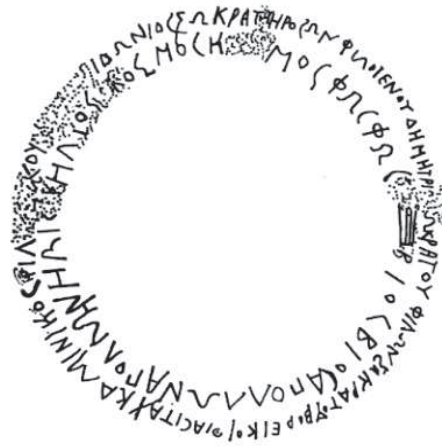
Рис. 3. Графіто фіаситів борейків

На чолі фіасу стоїть виходець з роду Каллініків, Καλλίνικος Φιλ[οξέ]νου, який виконував посаду епоніма у 329 72 р. до н. е. [14], членом фіасу також є його брат Геросон, крім того, до складу фіасу входять вихідці з роду Аристокритидів-Сократидів – брати Посейдоній, Деметрій та Філон. Це графіто датується видавцем 330-250 рр. до н. е., а на ґрунті синхронізації каталогу епонімів IOSPE I 2 201 – близько 320-314 рр. до н. е. [15].