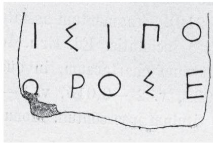
Рис. 5. Фрагмент IOSPE I 2 219

В.В. Латишев навів зразок читання цього фрагмента в редакції видавця Е.Р. Штерна: [Κτ]ησιπό[λεος]