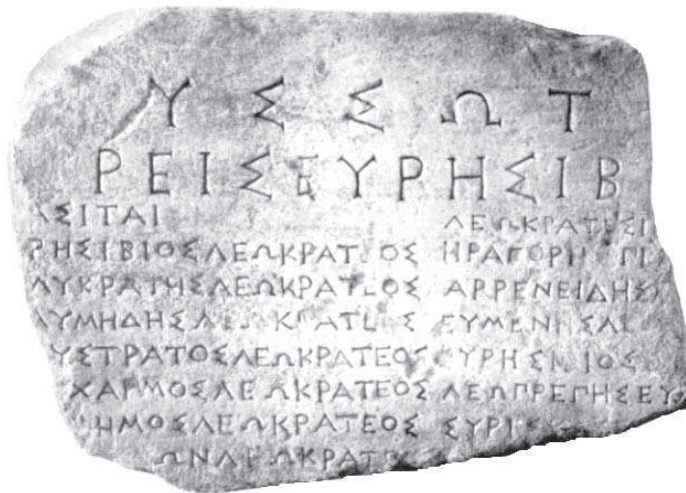
Рис. 2. Напис НО 71

жерців автором встановлено датування посвячення жерців Евресибіадів Зевсу Сотеру (НО 71) близько 327-322 рр. до н. е. [7], що припадає на нижню межу хронологічного інтервалу, який був запропонований Ю.Г. Виноградим та цілком відповідає датуванню А.С. Русяєвої [8]. З урахуванням висновків Ю.Г. Виноградова про синхронність посвячень НО 71 та НО 168, датування останнього також встановлюється у хронологічному діапазоні близько 327-322 рр. до н. е.