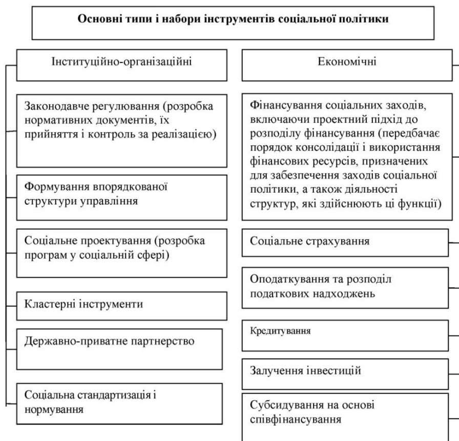
Рис 4. Основні інструменти розробки та реалізації соціальної політики

Вважаємо за доцільне здійснити поділ розглянутих інструментів соціальної політики на традиційні та сучасні інноваційні (табл. 1), що зумовлено сучасни-