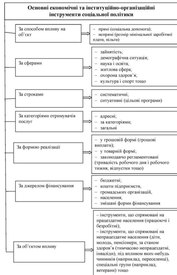
Рис. 3. Класифікація інструментів соціальної політики

Перш за все, здійснюється наукове вивчення реальної соціальної ситуації. На цьому етапі проводиться аналіз структури населення з метою виділення та кількісного і якісного опису об’єкта соціальної політики, вивчення потреб населення в цілому й окремих соціальних груп зокрема, можливостей і потенціалу окремих територій у вирішенні соціальних проблем. Далі на основі аналізу діючої моделі соціальної політики і виявлення проблем її реалізації відбувається формування коротко-, середньо- та довгострокових цілей політики в соціальній сфері, відбувається нормативно-правове закріплення сформульованого плану дій. У результаті розробляється перелік заходів щодо досягнення заявлених цілей, визначаються джерела фінансування, критерії оцінювання результатів діяльності. Крім того, в ході проведення соціальної політики постійно проводиться поточний моніторинг і, в разі необхідності, коригування напрямів діяльності з урахуванням фактичних результатів.