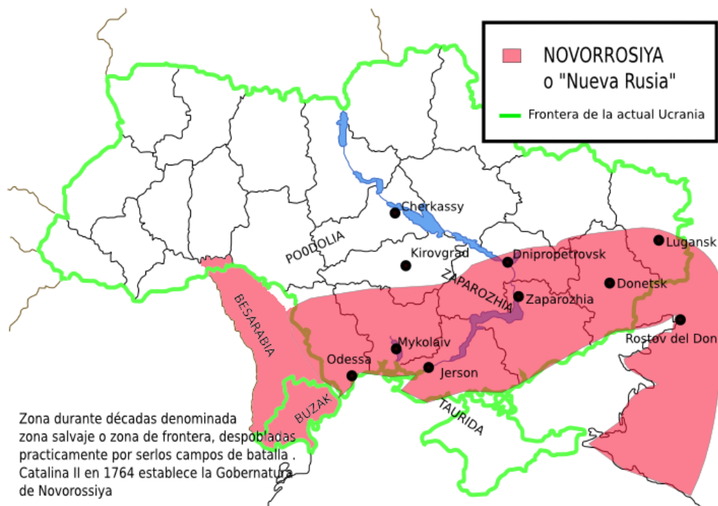
Zona durante décadas denominada zona salvaje o zona de frontera, despobladas practicamente por serlos campos de batalla . Catalina II en 1764 establece la Gobernatura de Novorossiya

1. Із приводу «територіальної єдності» Української держави висловлюються зазвичай дві полярні думки. Одна полягає в тому, що відмінності між регіонами України не слід занадто перебільшувати, і держава, в цілому, рухається до більшої унітаризації, інша – в тому, що регіональні відмінності є субстанціональними для України, і її чекає неминуча федералізація і навіть розпад.