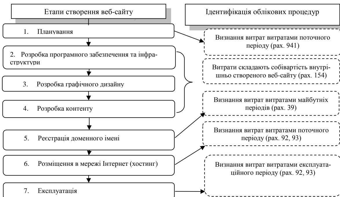
Рис. 3. Методика ідентифікації облікових процедур відповідно до етапів процесу створення веб-сайту підприємства

Процес створення веб-сайту можна розділити на етапи: планування, розробка додатків та інфраструктури, розробка графічного дизайну, введення змісту, реєстрація доменного імені, розміщення в мережі Інтернет, експлуатація. В залежності від етапу здійснення цього процесу існують особливості їх обліково-го відображення (рис. 3)