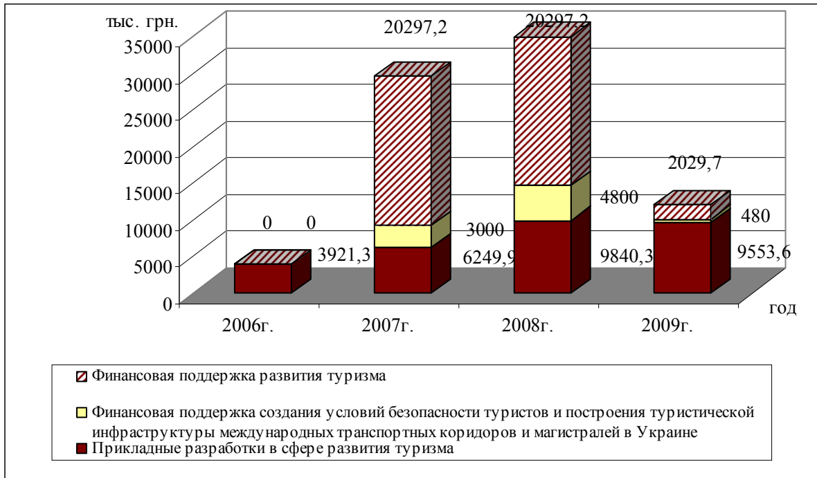
Рис. 2. Финансирование туризма в 2006-2009 гг. за счет средств государственного бюджета Украины

В 2006 г. наблюдается самая незначительная сумма (3921,3 тыс. грн), вложенная государством за счет средств государственного бюджета в развитие туризма (рис. 2), что связано с отсутствием статей «Финансовая поддержка развития туризма» и «Финансовая поддержка создания условий безопасности туристов и построения туристической инфраструктуры