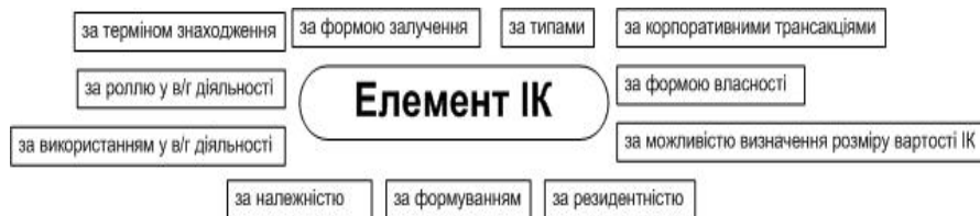
Рис. 2. Класифікаційні ознаки елементів інтелектуального капіталу підприємства

формування методик оцінювання ІК та вирішення різнопланових завдань управління ІК.