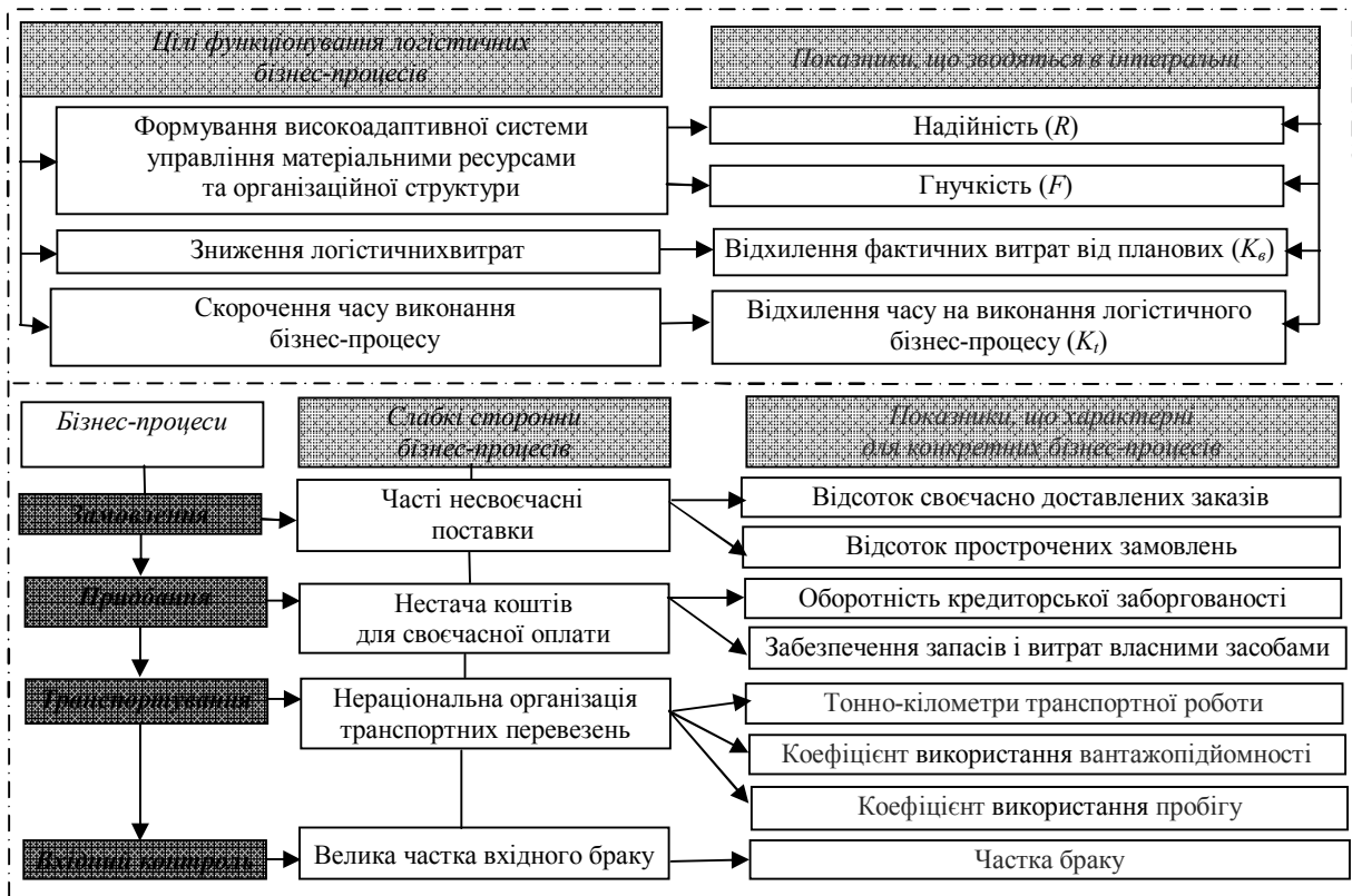
Рис. 2. Зв'язок показників бізнес-процесів із цілями та виявленими слабкими сторонами

Так, наприклад, для бізнес-процесу «Замовлення» – це відсоток своєчасно доставлених замовлень ( K_{св. зам.} ) та відсоток прострочених замовлень ( K_{пр. зам.} ).